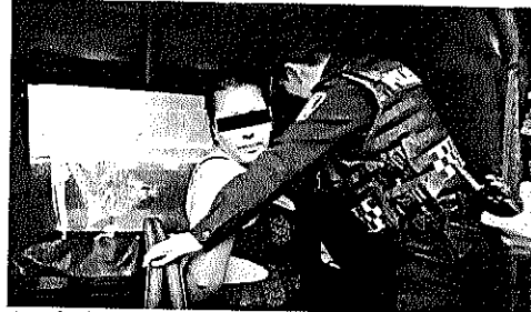
La mujer llevaba una peluca para despistar a la policía.