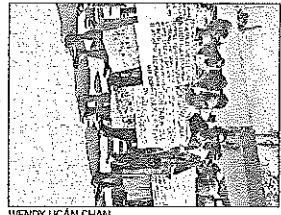
Un momento de la protesta de los ejidatarios de Popolnah

Tiempo "Han pasado varios años y ni un peso han pagado por derecho de paso, sabemos que dentro la Comunidad pagará pesos por metro cuadrado por las torres que hay, entonces imagínense cuánto se le debe al ejido por los 160,000 metros cuadrados que han ocupado", expresa. Además, dice que de acuerdo con un cálculo que han sacado, son más de 500 mil-