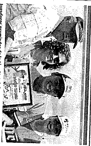
Jugadores premiados de la Liga Motuleña de Béisbol que ganaron en sus departamentos individuales.