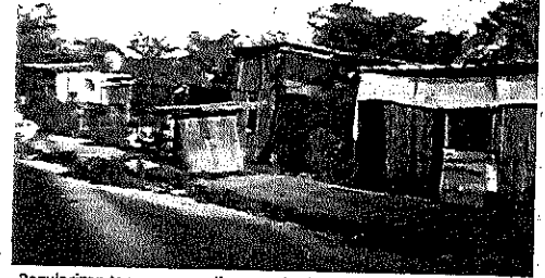
Regularizan terrenos que albergan alrededor de 488 familias.