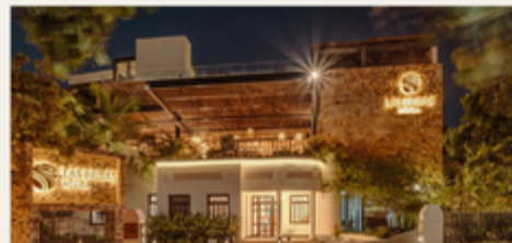
Las Brisas Mérida