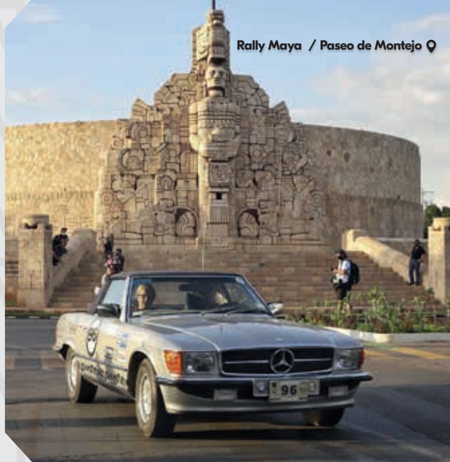
Rally Maya / Paseo de Montejo

El turismo es una de las actividades económicas en Yucatán, por lo que encontrarás opciones y empresas que cuentan con una gran oferta que se ajustan a tus necesidades para satisfacer la demanda de hospedaje, alimentos y servicios con mucho profesionalismo, lo que te asegura una gran experiencia en tu visita.