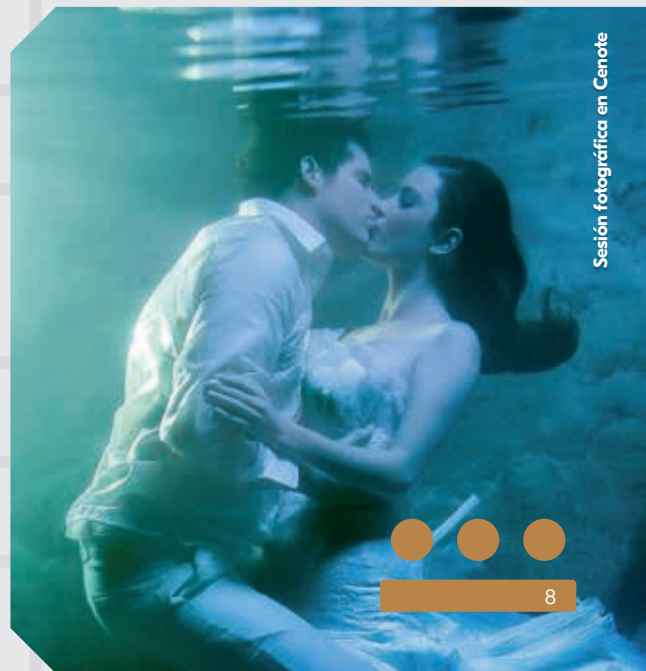
Sesión fotográfica en Cenote